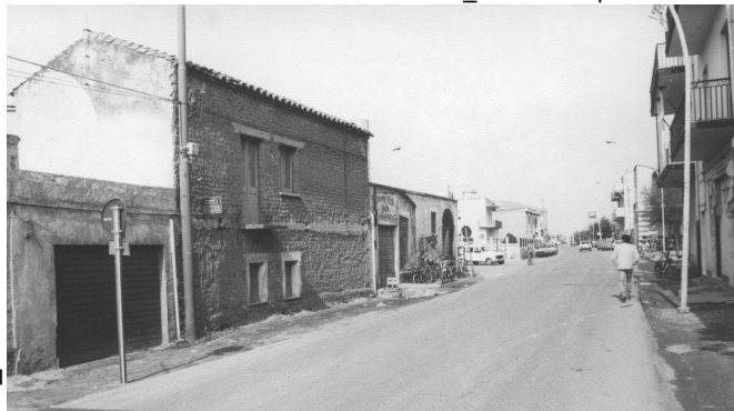
A_ Anni '60