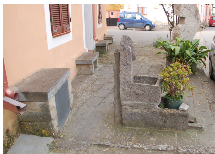
Verde urbano ed elementi artistici