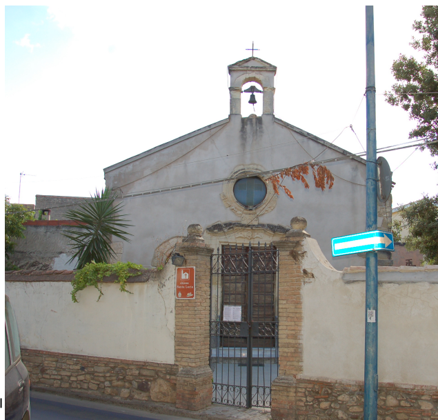
D _ 2016