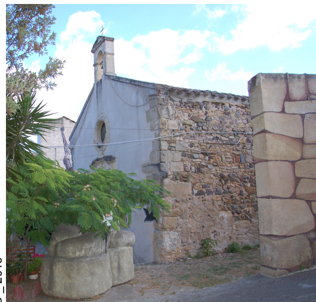
E _ 2016