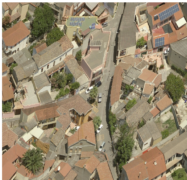
A _ 1984