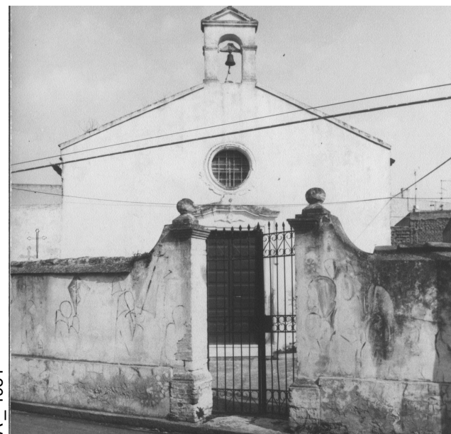
B _ 1984