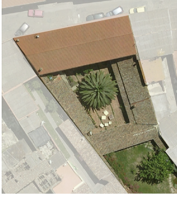
Ortofoto dello stato attuale scala 1:500

superficie lotto 2264.45 m 2 superficie coperta 606.18 m 2 superficie libera 1658.27 m 2 volume edificato 3718.23 m 3 altezza massima di gronda 7.15 m indice fondiario 3 mc/mq indice di fabbricazione 3.00 m 2 /m 3 larghezza fronte strada 24.60 m uso residenziale numero livelli piano terra e primo piano