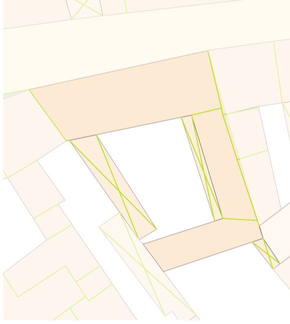
Rilievo GIS scala 1:500