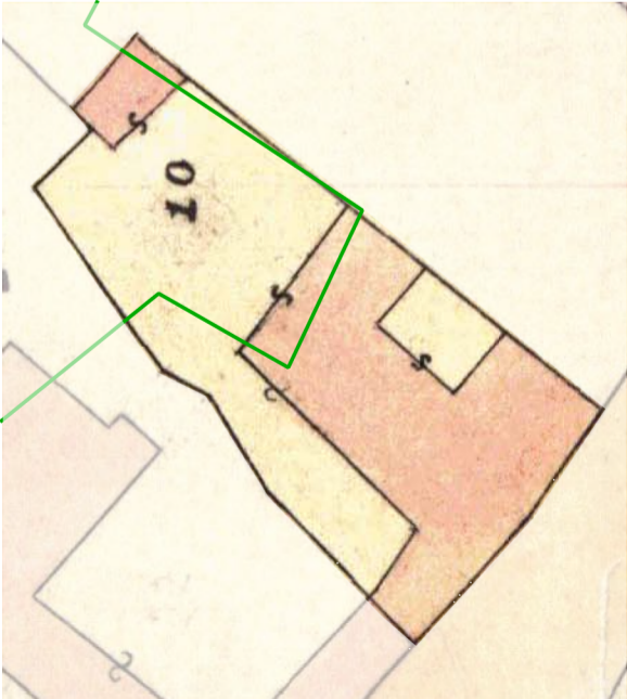
Individuazione tipologia storica _ Carta di impianto 1939 scala 1:500