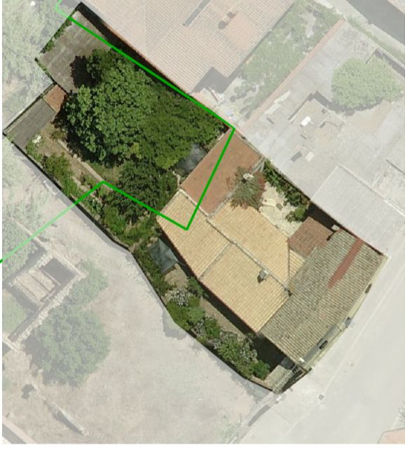
Ortofoto dello stato attuale scala 1:500

superficie lotto 558,23 m 2 superficie coperta 220,28 m 2 superficie libera 337,95 m 2 volume edificato 919,78 m 3 altezza massima di gronda 6,35 m indice fondiario 3 mc/mq indice di fabbricazione 1,65 m 2 /m 3 larghezza fronte strada 17,00 m uso residenziale numero livelli piano terra e primo piano