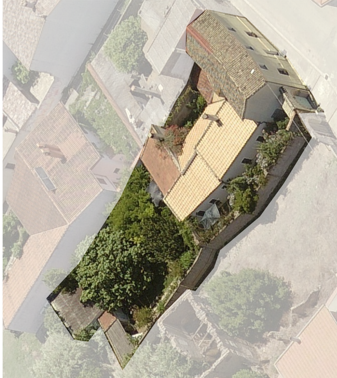
Foto obliqua stato attuale