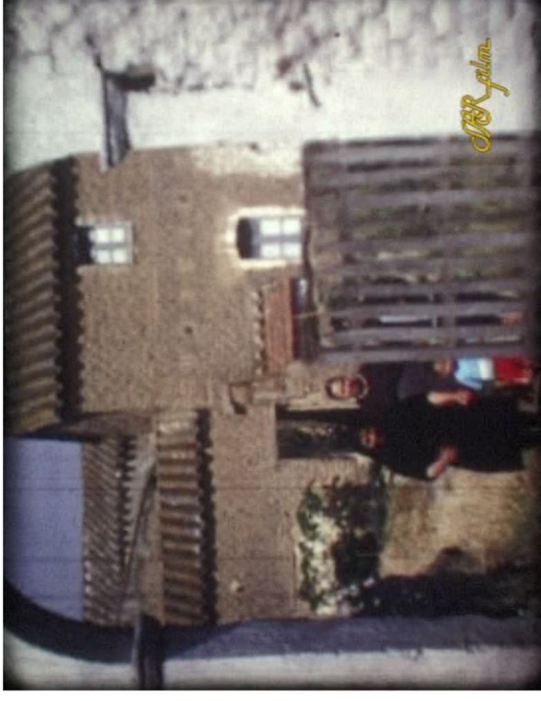
Documentazione Fotografica anni '60 _ UMI non identificata