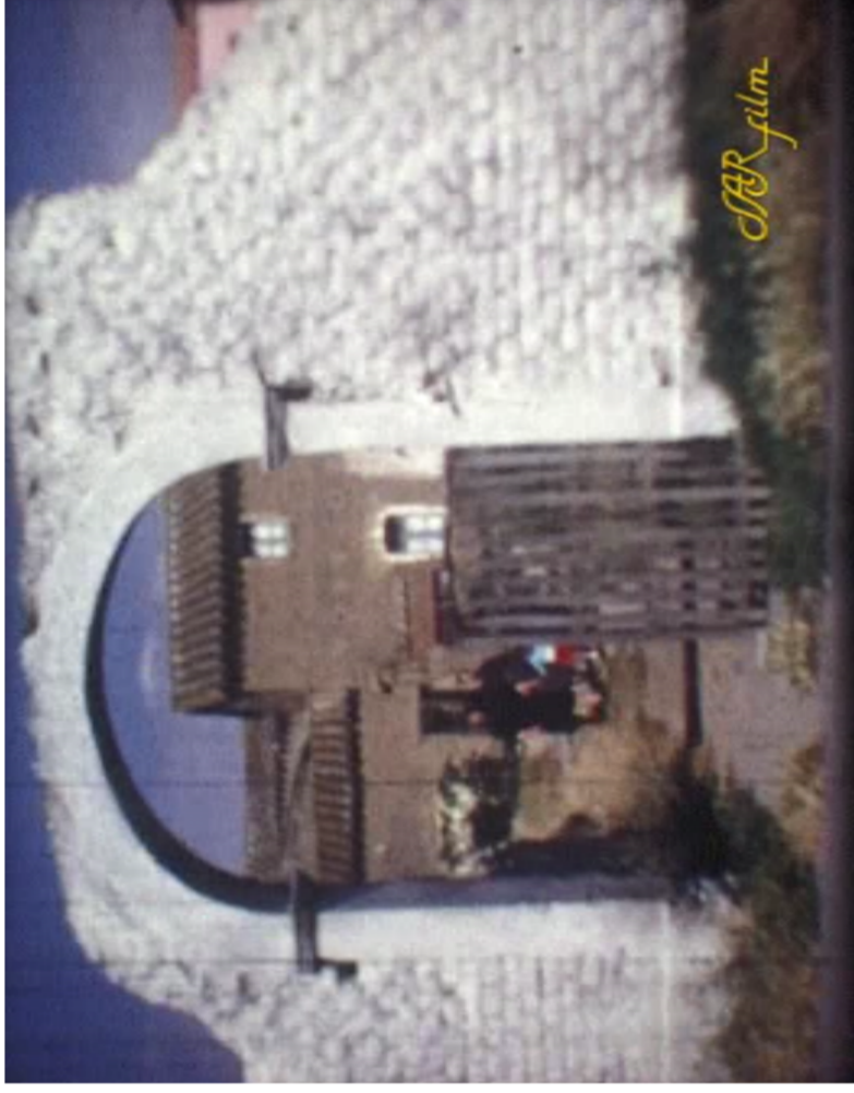
Documentazione Fotografica anni '60 _ UMI non identificata