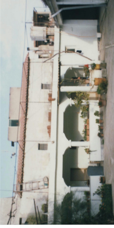
Documentazione Fotografica 1984 _ UMI 11.05