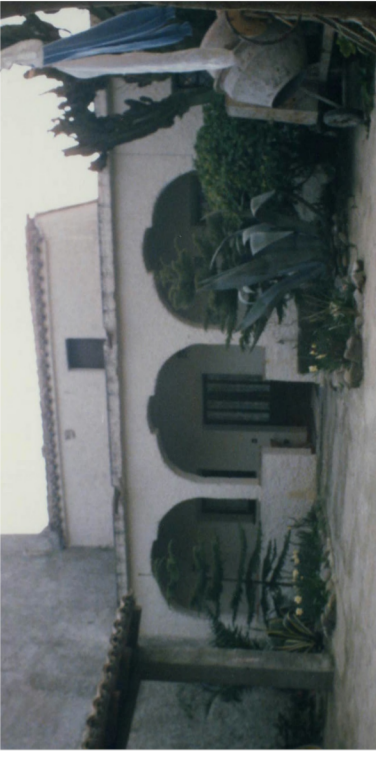
Documentazione Fotografica 1984 _ UMI 11.10