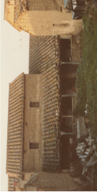
Documentazione Fotografica 1984 _ UMI 19.07