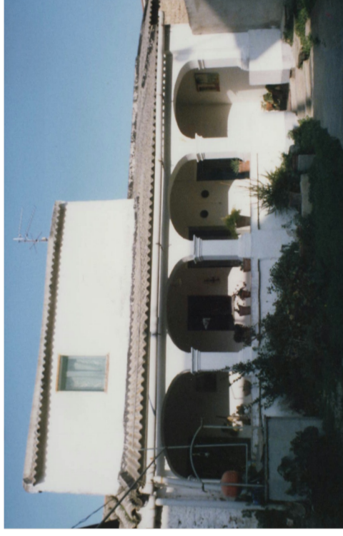
Documentazione Fotografica 1984 _ UMI 21.09