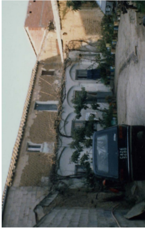
Documentazione Fotografica 1984 _ UMI 10.58

MURATURE: rivestimenti, inserti, placcaggi, tinteggiature spugnate o finto anticate, colori scuri o vivaci (ad eccezione dei murali che sono sempre ammessi) INFISSI: alluminio anodizzato, colori metallizzati