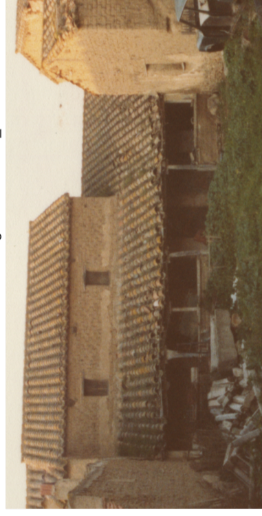
Documentazione Fotografica 1984 _ UMI 19.07