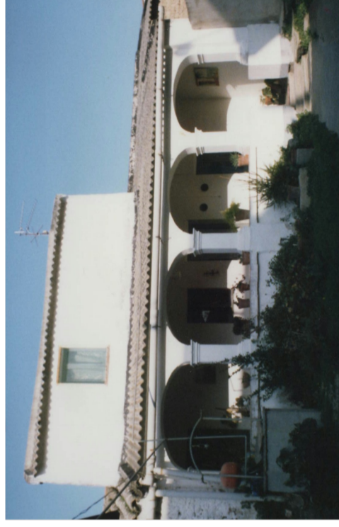
Documentazione Fotografica 1984 _ UMI 21.09