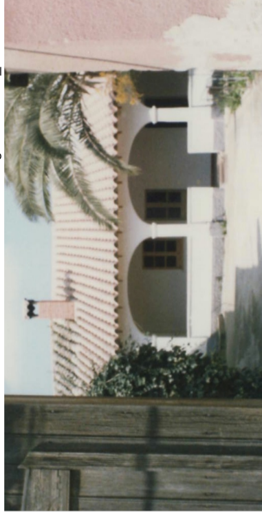
Documentazione Fotografica 1984 _ UMI 15.53