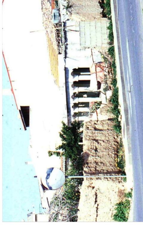
Documentazione Fotografica 1984 _ UMI 21.02