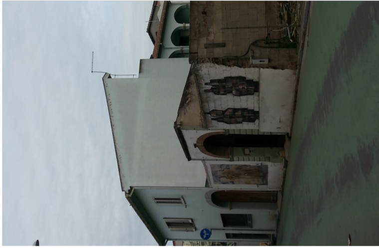
Documentazione Fotografica 2004 UMI 21.09