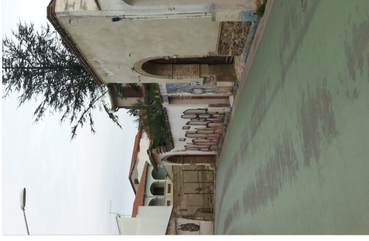
Documentazione Fotografica 2004 UMI 21.07