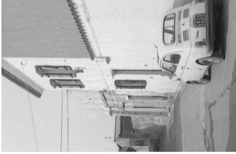
Documentazione Fotografica 1984 UMI 13.04 - 13.05

UMI riferimento: V 04 _ 13.04 _ 13.05 _ 21.09 _ 21.07