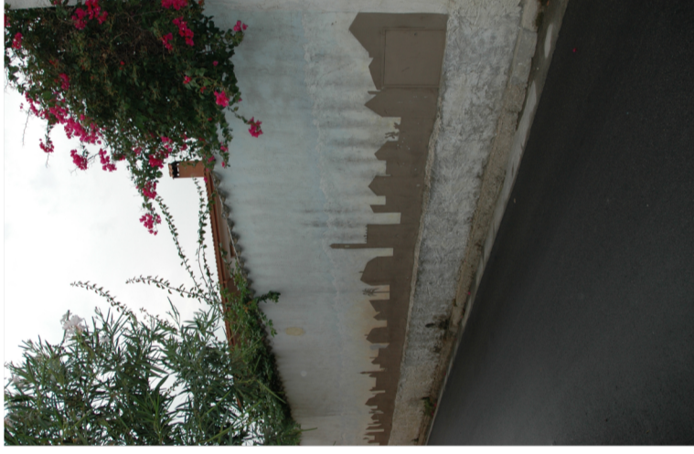
Documentazione Fotografica 2004 UMI 13.05