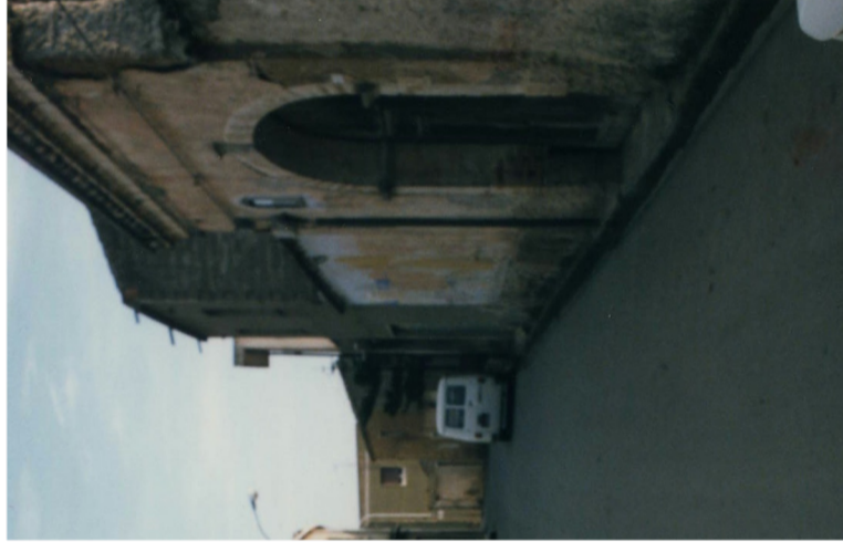
Documentazione Fotografica 2004 UMI 11.11