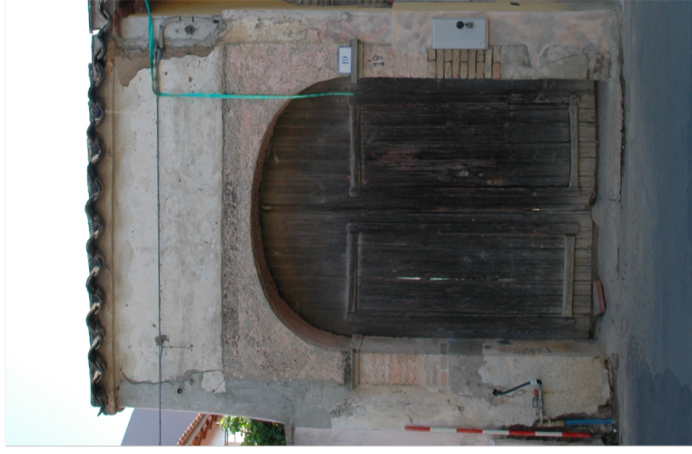
Documentazione Fotografica 2004 UMI 10.50

UMI riferimento: 10.50_11.10_11.11_21.09_23.01