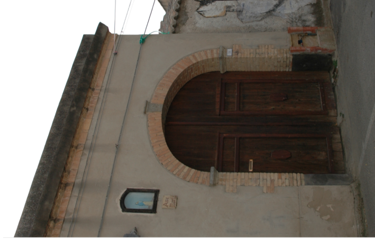
Documentazione Fotografica 2004 UMI 11.11