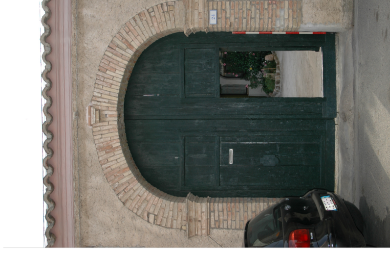
Documentazione Fotografica 2004 UMI 11.10