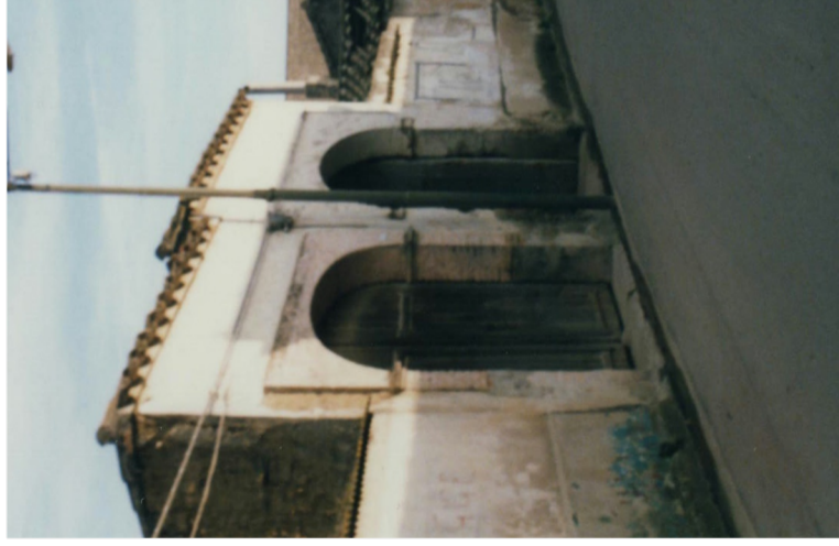
Documentazione Fotografica 1984 UMI 10.50