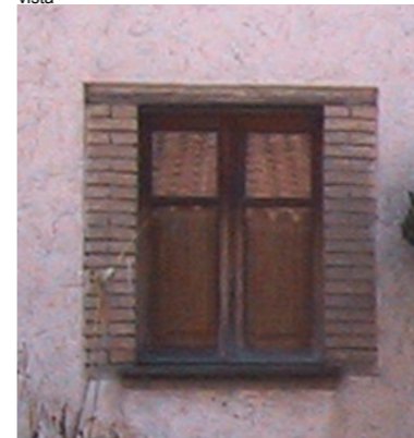
3.a.1.b.2.1 | Arco ribassato e stipiti in mattoni cotti a vista