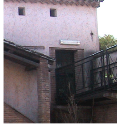
2.a.1.b.1.1 | Piattabanda e stipiti in mattoni cotti