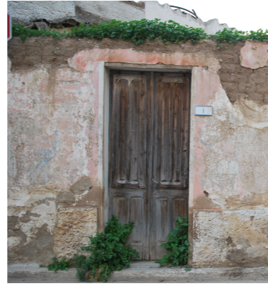
2.a.1.b.1.1 | Piattabanda e stipiti in mattoni cotti