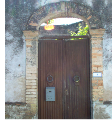
1.a.1.b.2.2 | Architrave in legno stipiti in mattoni cotti intonacati