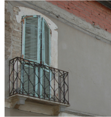
1.a.1.b.1.1 | Architrave in legno stipiti in mattoni cotti a vista